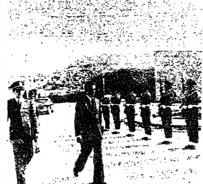
استقبل الرئيس سليمان فرنجية أمس ، سفر الأردن في لبنان السيد وليد صلاح الذي تناول طهماً اعداءه الى مكتبته . وقال السفير : زرت لبنان في عيد رأس السنة ، وقلت للسفير : زرت